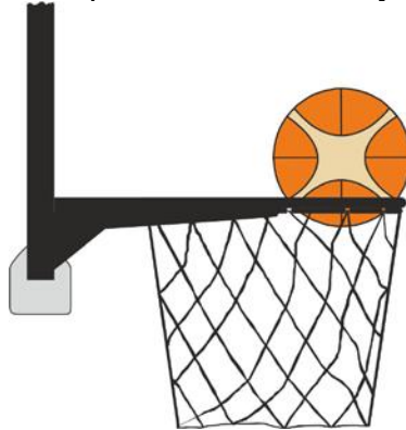
Рисунок 4. Мяч внутри корзины