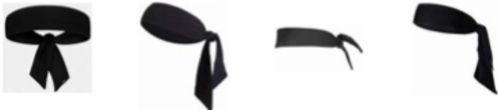
Рисунок 1. Пример головных повязок в виде косынки

4-4 Определение. Ношение головных повязок в виде косынки не разрешается.