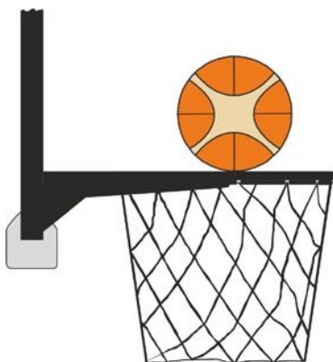
Рисунок 3. Мяч в контакте с кольцом

31-19 Определение. Нарушение помехи мячу во время броска с игры совершается защитником или нападающим, когда игрок касается корзины (кольца или сетки) или щита в тот момент, когда мяч находится в контакте с кольцом и все еще сохраняет шанс попасть в корзину.